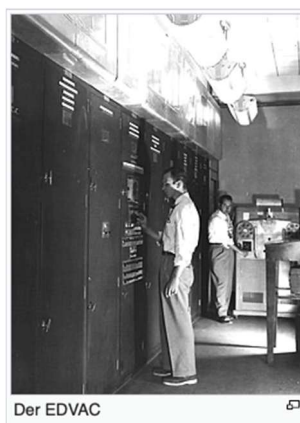
.... Computer früher