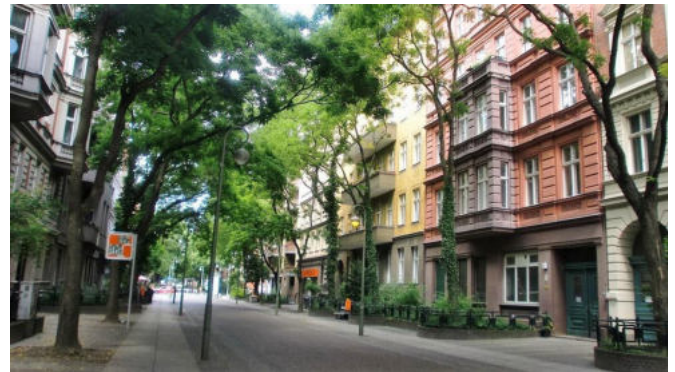
Wohnen im Kiez:

Genossenschaften und landeseigenen Wohnungsbaugesellschaften sind da schon weiter. Umzüge in bedarfsgerechte Wohnungen werden dort innerhalb der Gesellschaft unterstützt. Es ist ein Vorteil für alle Seiten. Probleme bereiten jedoch häufig die höheren Mieten und der Umzug in einen anderen Kiez.