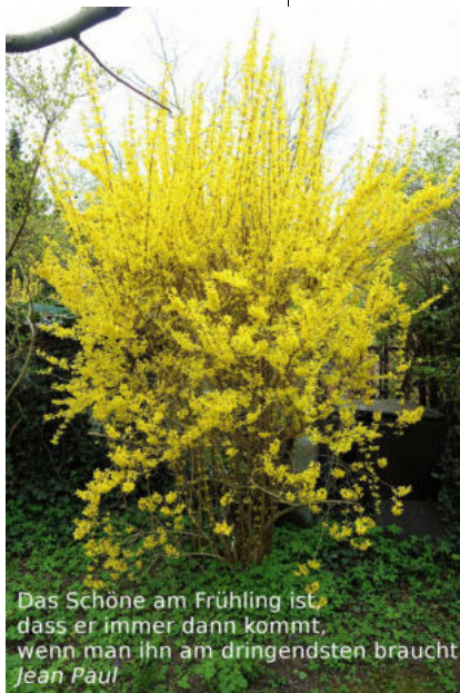
Das Schöne am Frühling ist, dass er immer dann kommt, wenn man ihn am dringendsten braucht. Jean Paul