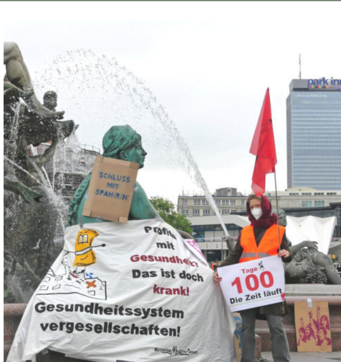
Demonstration für die Krankenhausbewegung 2021

Warum? Sie reden von Diktatur, wollen die Freiheit schützen und haben kein Vertrauen in Wissenschaft und Politik. Sie haben ihre Informationen aus dem Internet, wo sie in ihrer Meinung durch Algorithmen in ihrer verschwörerischen Auffassung noch bestärkt werden. Sie folgen montags zu Veranstaltungen, die von Rechtsradikalen angemeldet werden.