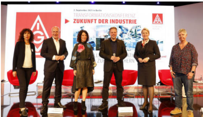
Veranstaltung der IG Metall Berlin am 2. September 2021 zur Transformation in der Industrie

Die Berliner IG Metall konzentriert sich auf die Transformation und hat ihren Focus auf eine Reihe von Betrieben gerichtet, um mittels Stärke die Belegschaften zukunftsfähig zu machen.