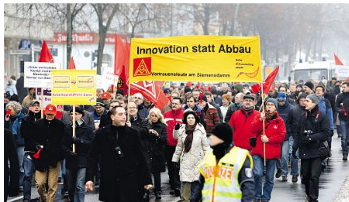
Beschäftigte von Nokia Siemens Networks demonstrieren in Berlin.

Vor Weihnachten gab es alarmierende Nachrichten für viele Beschäftigte in Berlin: Siemens gefährdet möglicherweise mit dem Programm Siemens 2014 die positive Entwicklung der Berliner Siemens-Betriebe. Die Weiterentwicklung des Standortes von Nokia Siemens Networks ist in Frage gestellt. Bei NSN laufen aktuell die Verhandlungen zu den geplanten Ausgliederungen der Charging-Entwicklung und des Optik-Werkes. Der Betriebsrat fordert ein Konzept für die Weiterentwicklung des gesamten Standortes. Osram benötigt dringend Zukunftsinvestitionen. »Auch wenn alle derzeit auf Berlin wegen seines Flughafendebakels einschlagen. Berlin kann Indus-